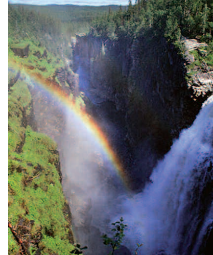
Hällingsåfallet - so etwas sieht man wirklich nicht alle Tage!

Vilseledaren – der „Irreführer“: Unter diesem Fremdenführer-Konzept finden im Sommer täglich unterschiedlichste Aktivitäten statt, wie z.B. Abseilen und Canyoning im Canyon Hällingsåfallet. Hier kommt es darauf an, auf der Abenteuer-Bahn der Natur möglichst viel Spaß zu haben, ohne auch nur einem Sträuchlein Schaden zuzufügen. Desweiteren werden Ahnenforschung, Reiten auf Islandpferden, Wanderungen durch