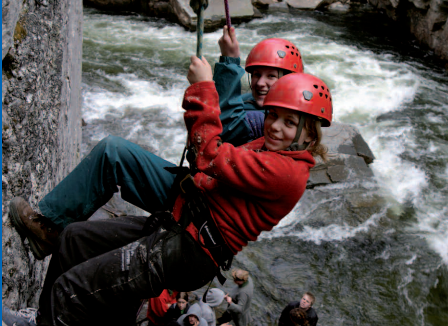
Canyoning von der längsten, mit Wasser gefüllten Schlucht im Norden Europas – eins der Abenteuer des Veranstalters Vilseledaren.